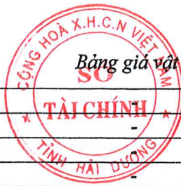
Bảng giá vật liệu xây dựng công bố tháng 10 năm 2020 tại Hải Dương