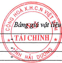
Bảng giá vật liệu xây dựng công bố tháng 10 năm 2020 tại Hải Dương