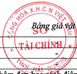
Bảng giá vật liệu xây dựng công bố tháng 10 năm 2020 tại Hải Dương