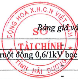
Bảng giá vật liệu xây dựng công bố tháng 10 năm 2020 tại Hải Dương