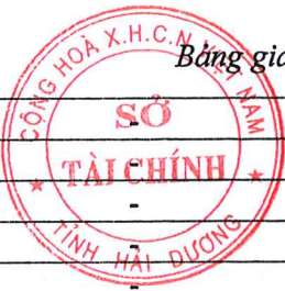
Bảng giá vật liệu xây dựng công bố tháng 10 năm 2020 tại Hải Dương