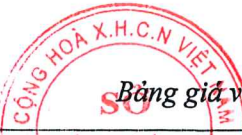
Bảng giá vật liệu xây dựng công bố tháng 10 năm 2020 tại Hải Dương