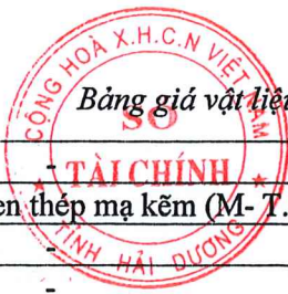
Bảng giá vật liệu xây dựng công bố tháng 10 năm 2020 tại Hải Dương