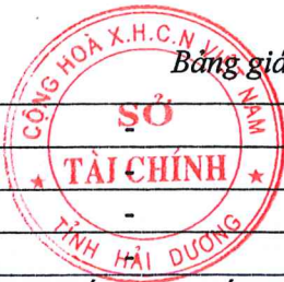
Bảng giá vật liệu xây dựng công bố tháng 10 năm 2020 tại Hải Dương