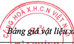
Bảng giá vật liệu xây dựng công bố tháng 10 năm 2020 tại Hải Dương