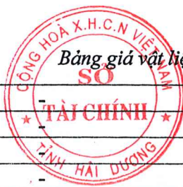
Bảng giá vật liệu xây dựng công bố tháng 10 năm 2020 tại Hải Dương