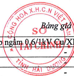
Bảng giá vật liệu xây dựng công bố tháng 10 năm 2020 tại Hải Dương