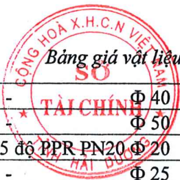
Bảng giá vật liệu xây dựng công bố tháng 10 năm 2020 tại Hải Dương